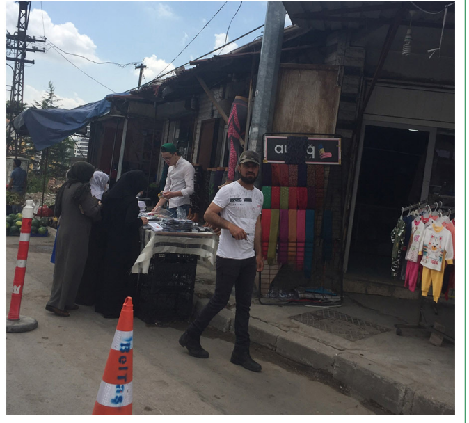
Şekil 2. Evde-kal döneminde çalışma alanından görüntüler.