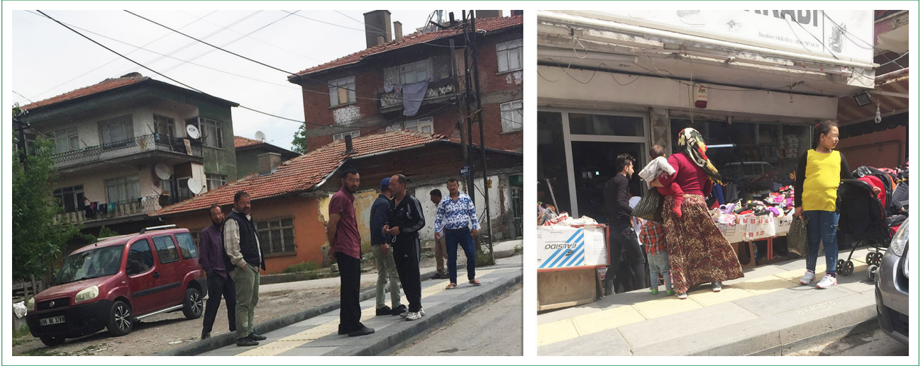
Şekil 3. Salgın tedbirlerine uymayan Suriyeli mülteciler.

parklar, tanıdık esnaf işletmeleri) zaman geçirmenin özellikle Suriyeli erkekler için gündelik yaşantının bir parçası olduğu belirlenmiştir. Bu sebeple dışarıda vakit geçirmenin, koyulan kuralları reddetmeye neden olabilecek kadar güçlü bir sosyal gereksinim olduğu söylenebilir. Alandaki denetimlerin azlığı da bu eğilimi desteklemektedir.