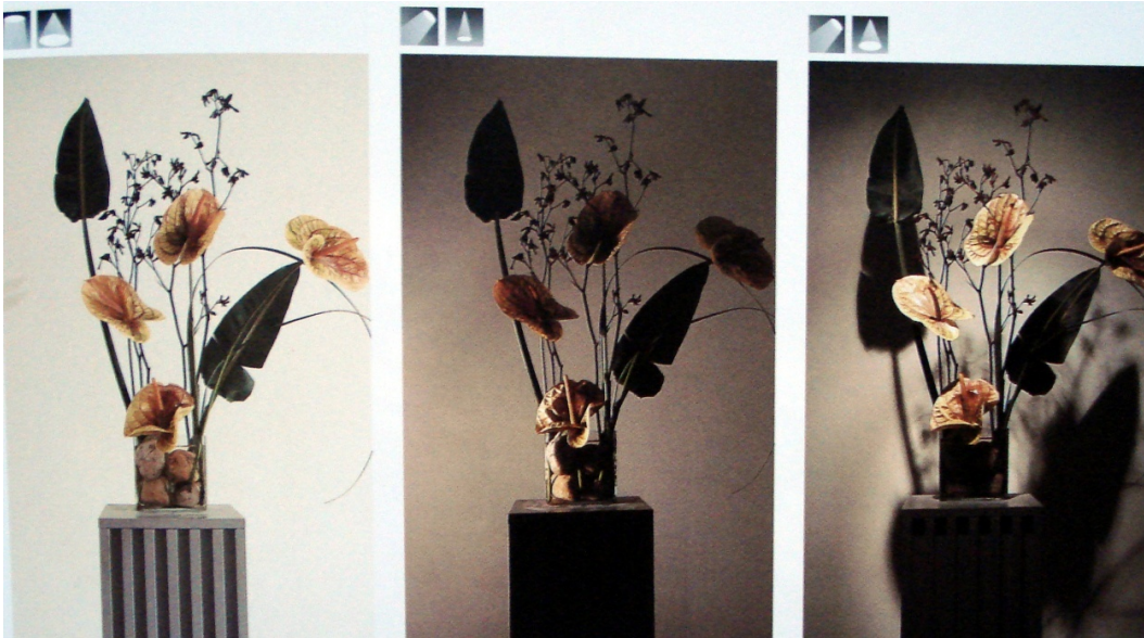
ŞEKİL 3. Işık/gölge etkisi [7].

Günümüz tasarım anlayışında renk, biçim ve formların daha yalın bir hale indirgenmesiyle “less is more/az çoktur” anlayışı daha çok ön plana çıkmıştır. Bazı tasarımlarda aydınlatmayla kavramı, görsel anlatım yaklaşımlarını ve biçimini temel öğelere indirmek; hatta kullanılan malzemeyi değişime uğratmadan kendi niteliği ve renginden yararlanmak, yapıtları kompozisyonlara yüklenen ifadelerden arındırmak, günümüzde benimsenen yaklaşımlardandır.