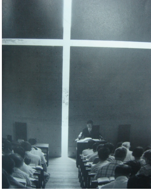
ŞEKİL 5. Işık Kilisesi iç mekân görünüşü (Tadao Ando).