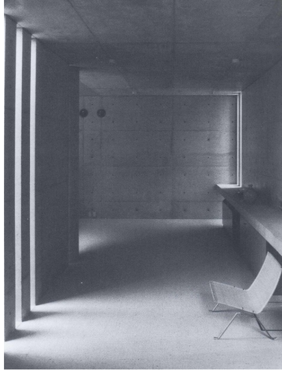
ŞEKİL 1. Ishii evi geçiş mekânı iç mekân görünüşü (Tadao Ando).

Yapay aydınlatmanın mimarlığa katılımıyla başlayan süreç içerisinde mekânın ışık ile girdiği iletişim hızlı bir dönüşümü de beraberinde getirmiş ve mekân kavramına farklı boyutlar getirmiştir [6].