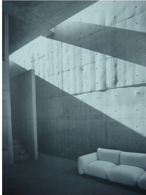
ŞEKİL 4. Koshino evi (Tadao Ando).

Mekân tasarımında pek çok farklı kombinasyonla yararlanılabilecek bir nitelik taşıyan ışık, nitel ve nicel özellikleri nedeniyle kullanıcısı üzerinde hem görülebilen hem de görülemeyen birçok farklı etkiye sahiptir. Bunlar ışığın; fizyolojik, biyolojik ve psikolojik özellikleri olarak karşımıza çıkarlar. Işığın fizyolojik özellikleri ışık ışınlarının göze girmesi ile başlar, biyolojik sistem üzerindeki etkileri ile devam eder ve psikolojik etkisi ile son bulur. Bu bakımdan ışık; kullanıcısı üzerinde uyandırdığı canlandırıcı, heyecan verici, kasvetlendirici hüznendirici, ilgi çekici gibi duygusal özellikleri sayesinde mekânların algılanmasında farklılıklar sağlamaktadır.